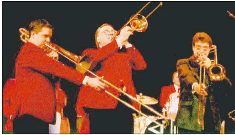
Mitreibend: Das „European Swing Orchestra“. Im September kommen die Briten auf ihrer Deutschland-Tour in die Rosenstadt.

derful“ begeistert vor allem die jazzige Interpretation des Frank-Sinatra-Klassikers „I Love Paris“ (aus dem Film „Can Can“ 1960).